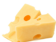
Kaasresten zonder korst