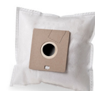
Inhoud van stofzuigerzak