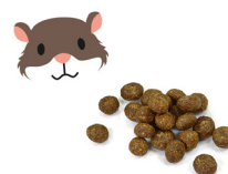
Keutels van knaagdieren