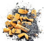
Tabak en peuken