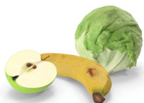
Resten van groente en fruit